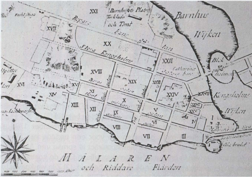
Afb. 1: Kungsholmen, Stockholm 1754 (detail) waar de fabriek van Carl Aspegren stond.

bekend is met welk onderdeel van de productie hij zich bezighield. Of hij na het aflopen van zijn jaarcontract terug keerde of in Stockholm bleef is eveneens niet bekend.